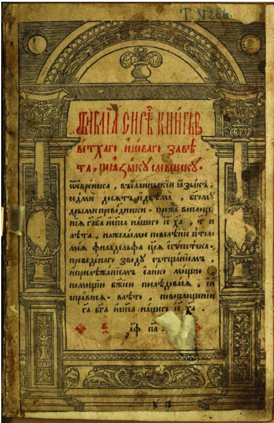
Титульный лист Острожской Библии. Острог, 1581 год

Острожская Библия явилась последним творением московского печатника. После нее целых книг он уже не печатал.